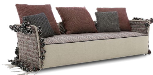
THREE SEATER SOFA / DIVANO TRE POSTI 240 x 85 x 65 cm (LxPxH)