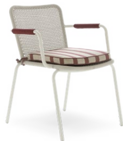
CHAIR WITH ARMRESTS* / SEDIA CON BRACCIOLI* 60 x 63 x 80 cm (LxPxH)