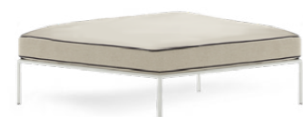
OTTOMAN / POUF 90 x 90 x 38 cm (LxPxH)