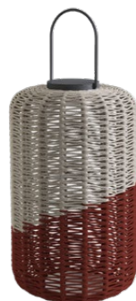
BIG* / GRANDE* 36 x 82 cm (ØxH)