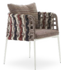
CHAIR* / SEDIA* 68 x 62 x 72 cm (LxPxH)

La collezione Eva include 4 diversi moduli di seduta: