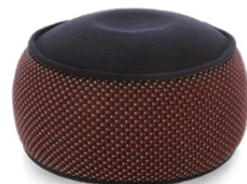
MAGLIA OTTOMAN 80 x 35 cm (ØxH)