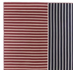
VERSION 2* / VERSIONE 2* 400 x 400 cm (LxH)