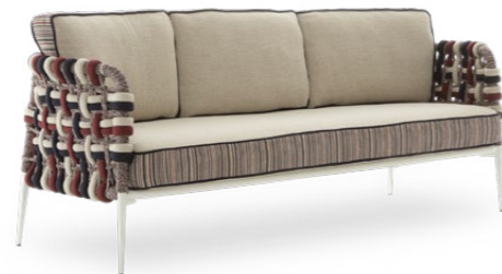
THREE SEATER SOFA / DIVANO TRE POSTI 213 x 79 x 72 cm (LxPxH)