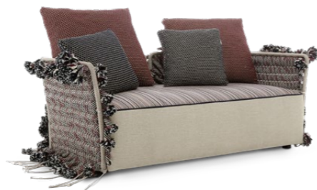
TWO SEATER SOFA / DIVANO DUE POSTI 165 x 85 x 65 cm (LxPxH)