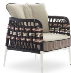
ARMCHAIR* / POLTRONA* 85 x 79 x 72 cm (LxPxH)