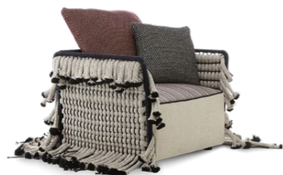
ARMCHAIR / POLTRONA 90 x 85 x 65 cm (LxPxH)

The Brique collection includes three different module seaters: La collezione Brique include tre diversi moduli di seduta: