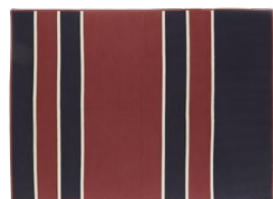
VERSION 1* / VERSIONE 1* 300 x 400 cm (LxH)

La collezione di tappeti include 4 diverse dimensioni e un'opzione di dimensioni personalizzate: