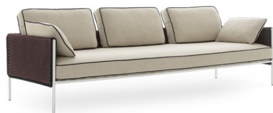
THREE SEATER SOFA / DIVANO TRE POSTI 266 x 90 x 62 cm (LxPxH)