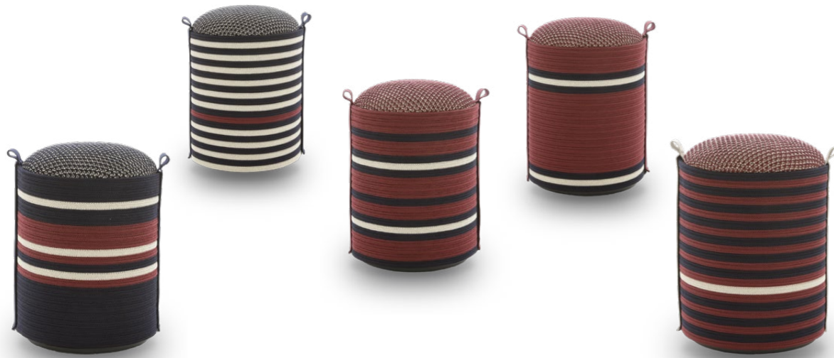
From left to right / In ordine da sinistra a destra: Version 1, Version 2, Version 3, Version 4, Version 5

Il pouf Pantheon è la combinazione perfetta di comfort e stile. I pouf sono realizzati a mano in Italia. Rivestito con trecce cucite di diversi colori, il pouf è realizzato con una speciale tecnica di lavorazione a maglia con materiali selezionati che ne garantiscono la durevolezza e la versatilità. Design semplice ed elegante per aggiungere un tocco di eleganza a qualsiasi spazio. La versatilità è adatta sia per ambienti interni che esterni.