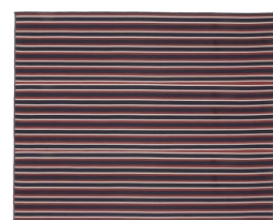
VERSION 3* / VERSIONE 3* 300 x 400 cm (LxH)