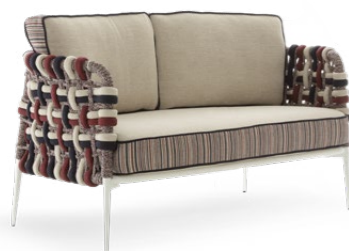
TWO SEATER SOFA / DIVANO DUE POSTI 178 x 79 x 72 cm (LxPxH)