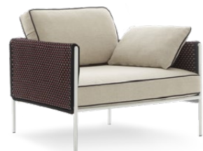
ARMCHAIR / POLTRONA 90 x 90 x 62 cm (LxPxH)