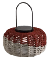
SMALL* / PICCOLA* 36 x 42 cm (ØxH)

La collezione Susy comprende tre diverse dimensioni: