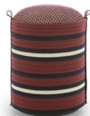
PANTHEON OTTOMAN** 37 x 45 cm (ØxH)

La collezione di pouf comprende due modelli: