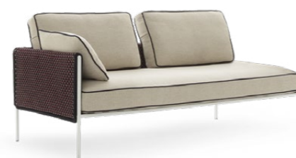
LEFT TERMINAL - RIGHT TERMINAL UNIT / TERMINALE SINISTRO - TERMINALE DESTRO 178 x 90 x 62 cm (LxPxH)