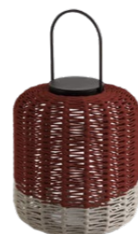
MEDIUM* / MEDIA* 36 x 62 cm (ØxH)