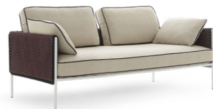
TWO SEATER SOFA / DIVANO DUE POSTI 178 x 90 x 62 cm (LxPxH)