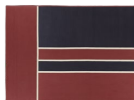
VERSION 4* / VERSIONE 4* 300 x 400 cm (LxH)